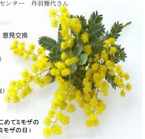
国際女性デーは女性に感謝をこめてミモザの花を贈る日ともされています。「ミモザの日」