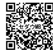
セダウミニブック