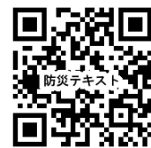
みんなの力を活かす 地域防災力UP テキスト